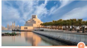
متحف الفن الإسلامي