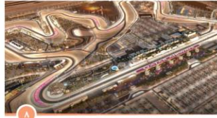
حلبة لوسيل الدولية