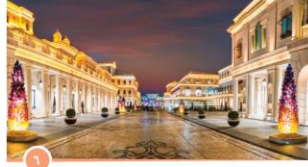
قرية كنارا الثقافية