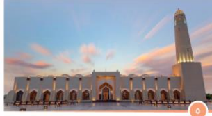
مسجد الإمام محمد بن عبد الوهاب