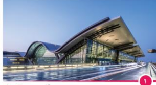
مطار حمد الدولي