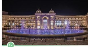
بلاس فاندوم مول